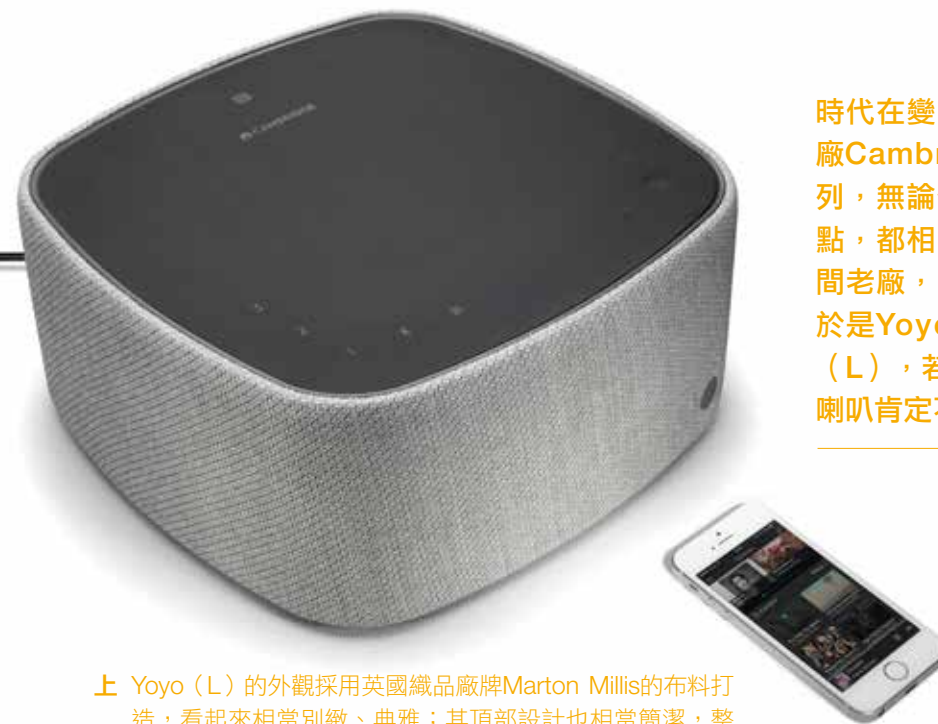
上 Yoyo (L) 的外觀採用英國織品廠牌Marton Mills的布料打造，看起來相當別緻、典雅；其頂部設計也相當簡潔，整體給人高雅的質感，可以為居家生活增添一些品味。

不過在這邊筆者要提醒您，Yoyo (L) 雖然可以透過HDMI ARC連接電視，但它只支援LPCM/PCM2.0